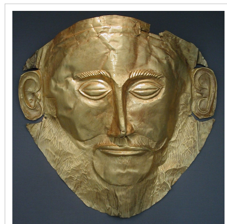
La llamada Máscara de Agamenón descubierta por Schliemann en Micenas (1876).

En las excavaciones halló cinco tumbas (en un recinto que ha sido llamado Círculo funerario A) con un total de 20 cadáveres, y en torno a ellos abundantes y ricos ajuares funerarios, con numerosos objetos de oro, bronce, marfil y ámbar. Además halló sesenta dientes de jabalí y un numeroso grupo de sellos con grabados de escenas religiosas, de luchas o de caza. Entre estos hallazgos estaba la llamada máscara de