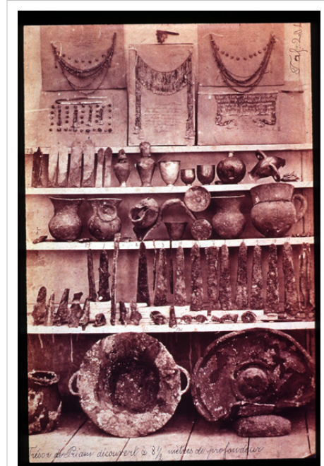
El tesoro de Príamo

En 1873 descubrió una colección de objetos y joyas de oro que llamó Tesoro de Príamo. La hizo trasladar ilegalmente a Grecia y por ello, en 1874, fue acusado de robo de bienes nacionales por el Imperio otomano y luego condenado a pagar una multa. Para volver a tener la posibilidad de que las autoridades turcas le permitieran volver a excavar en el futuro, pagó una indemnización mayor y donó algunos hallazgos al museo de Constantinopla. Por otra parte, la comunidad científica cuestionaba sus métodos y sus resultados.